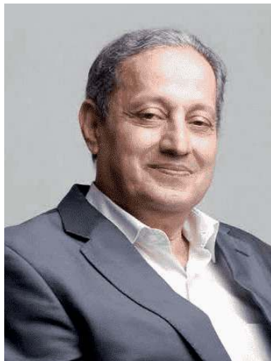
PAR FAOUZI SKALI

Le sens de la prière et de l'adoration renvoie du point de vue le plus profond à une forme de connaissance spirituelle. Le terme prière en arabe est généralement traduit par celui de «salât». Le Coran l'emploie aussi bien pour désigner l'office accompli par le musulman au moins cinq fois par jour que pour évoquer la Prière divine par laquelle Dieu, dit le Coran, «est Celui qui prie sur vous ainsi que Ses anges afin de vous faire sortir des ténèbres à la lumière» (Cor. 33/42). Dans cette perspective spirituelle ce passage «des ténèbres à la lumière» désigne le processus d'une connaissance par laquelle l'orant est amené à réaliser à travers sa propre prière le vœu et l'aspiration de Dieu à être connu.