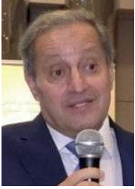
PAR FAOUZI SKALI

Les corporations de métiers avaient un lien direct avec les confréries soufies et leurs pratiques spirituelles. Cette connexion entre futuwwa et soufisme inaugurerait vers les 12-13e siècles de l'islam un processus social qui aboutira en fin de compte à la réforme exceptionnelle du calife abbasside al Nâsir li dîn Allah (m. 620/1233). L'idée était d'étendre cette notion de «futuwwa», au-delà des corporations de métiers, dans les instances de gouvernement.